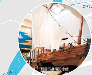
銭屋五兵衛記念館