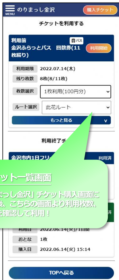
〔チケット一覧画面〕