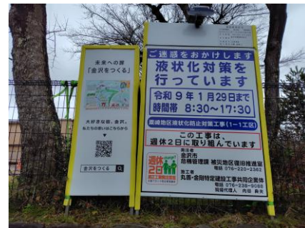
小学校横に工事看板を設置しました