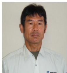
現場代理人(丸善建設)

大規模かつ技術難度の高い工事を施工する際に、技術力などを結集して工事の安定的な施工を確保するため、工事ごとに結成される組織のことを指します。略して、JV(ジェイフイ)とも呼ばれます。今回は、丸善建設と金剛建設で構成された特定建設工事共同企業体(JV)で、代表者は丸善建設です。