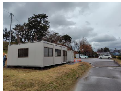
小学校裏のスペースに現場事務所を設置しました