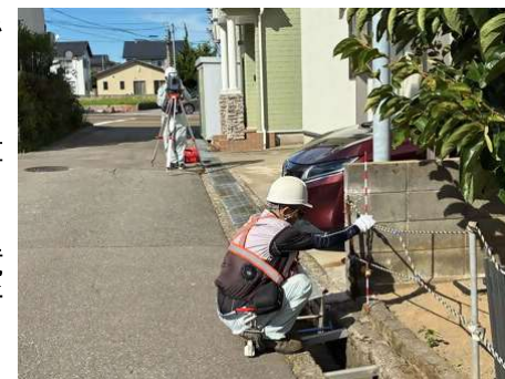
境界位置の測量作業状況

また、並行して法務局等の関係機関と境界復元方法について協議を行っており、所有者の皆様へ早期に復元案を提示できるよう作業を進めています。