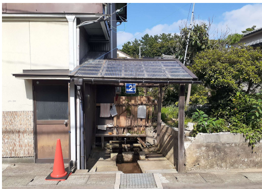
地震直後の「上の清水」

現在、地震の影響により、「上の清水」の上屋は取り壊され、配管の一部が破損していることで、流れる水が少なくなっています。今後、地下水位低下工法による液状化対策の影響などを踏まえ、町会と協議しながら復旧方法について検討していきます。