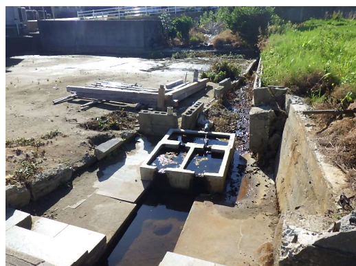
現在の「上の清水」（上屋取壊し後）