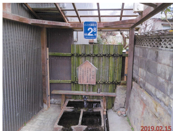
上の清水

現在、地震の影響により、「上の清水」の上屋は取り壊され、配管の一部が破損していることで、流れる水が少なくなっています。今後、地下水位低下工法による液状化対策の影響などを踏まえ、町会と協議しながら復旧方法について検討していきます。