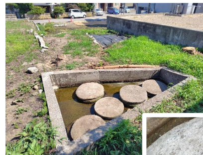
“上の清水”の湧水源

今後、調査結果や液状化対策の影響を踏まえ、地域の皆様と一緒に保存方法について検討していきます。