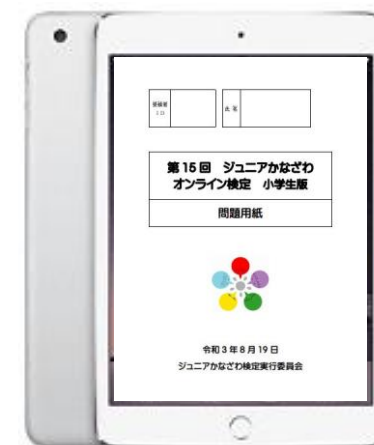
1人1台端末イメージ