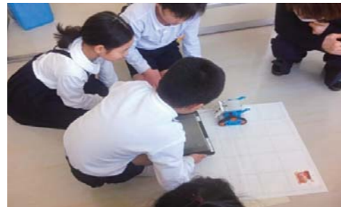
大徳小学校でのプログラミング公開授業(平成31年3月)