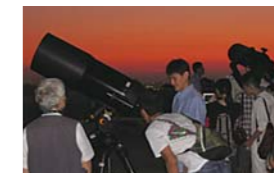
望遠鏡での天体観望