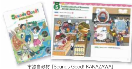
市独自教材「Sounds Good! KANAZAWA」