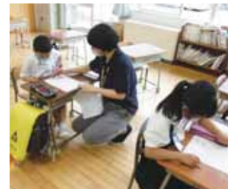
放課後の補充指導の様子