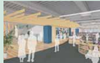
2階 図書コーナー(イメージ)