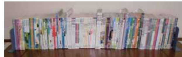
令和3年度から中学校で使用される文部科学大臣の検定を経た教科書の中から、金沢市で使用する教科書を採択します。