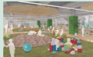
1階 木の広場(イメージ)