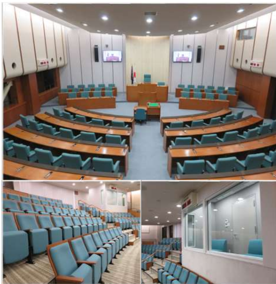
上：議場全景 左下：傍聴席 右下：親子傍聴席