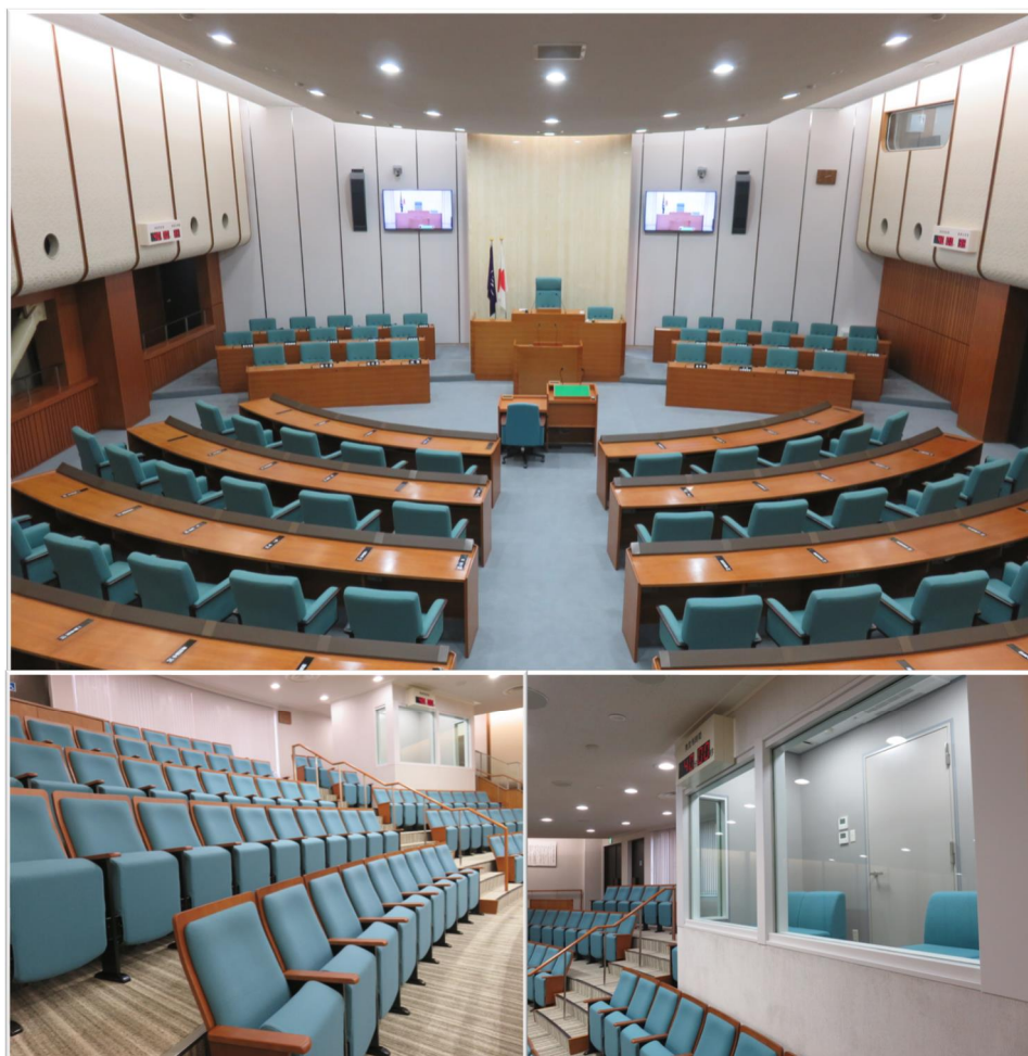
上：議場全景 左下：傍聴席 右下：親子傍聴席